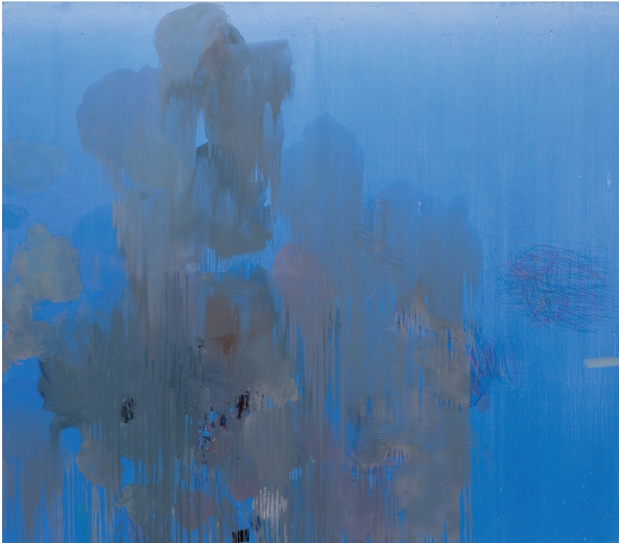
Matthias Reinmuth The Winner Takes it All , 2011 óleo, acrílico y lápiz sobre lienzo 200 x 230 cm