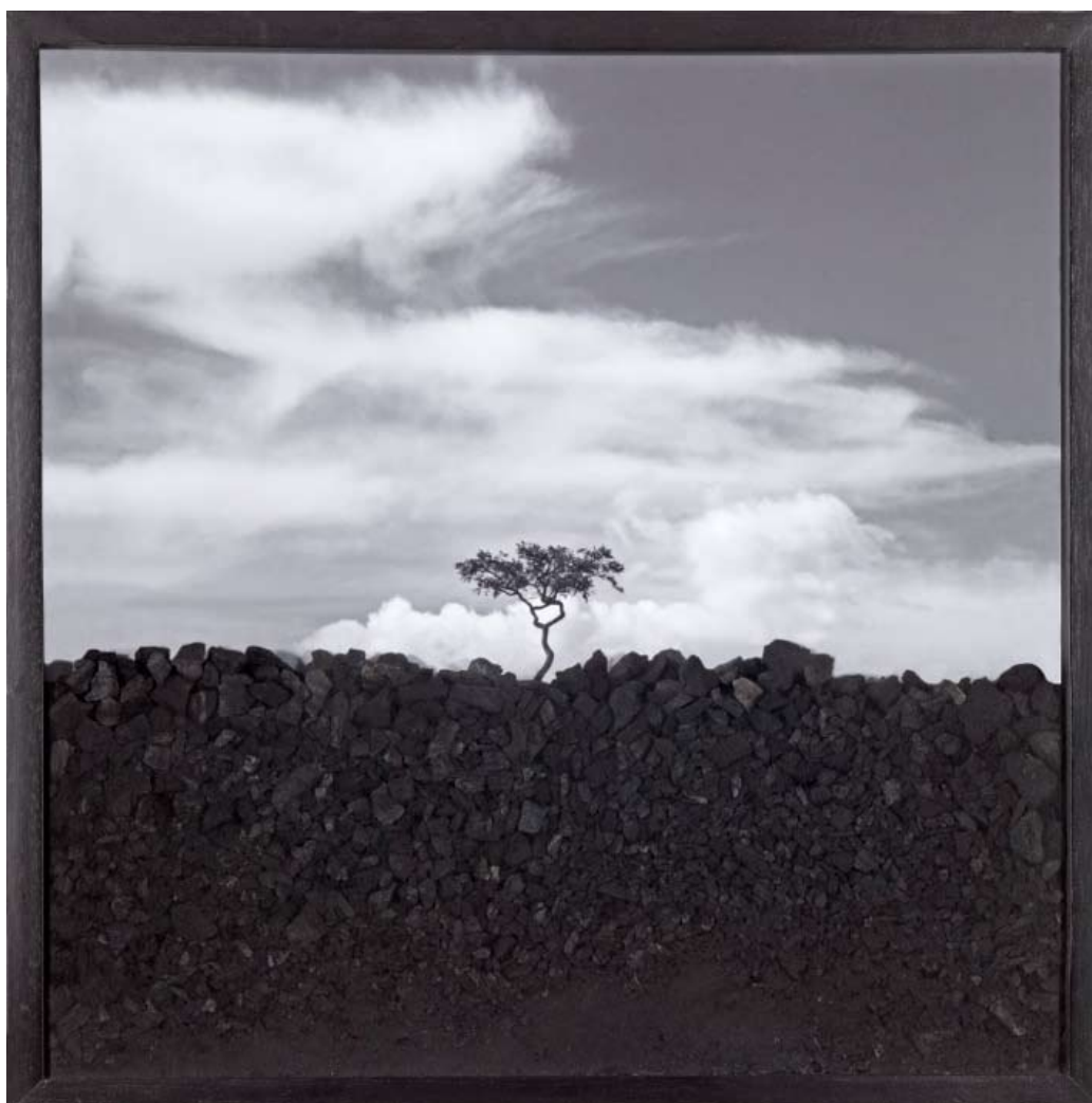
Espaço confinado #001 , 2014 Impression minérale sur papier coton, charbon 45 x 45 cm Édition : 1 + 1 E.A.