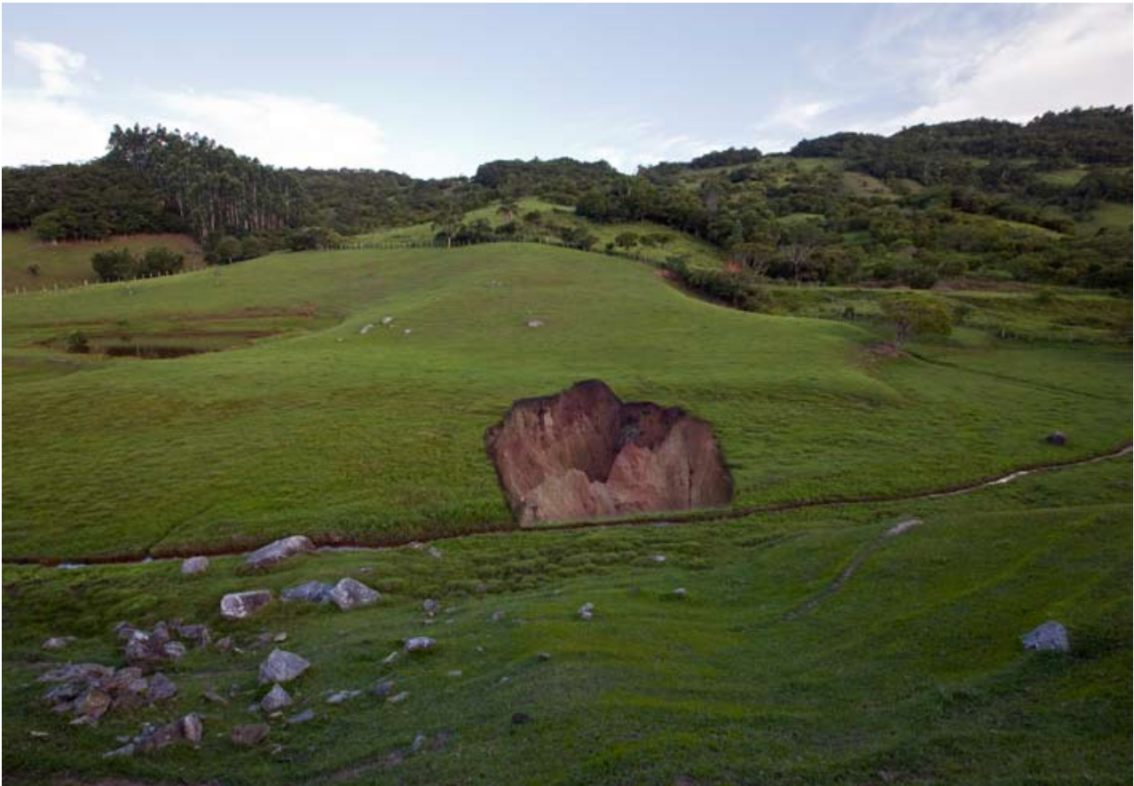
Testemunho #12 , 2014 Impression minérale sur papier coton 106 x 149 cm Édition : 3 + 1 E.A.