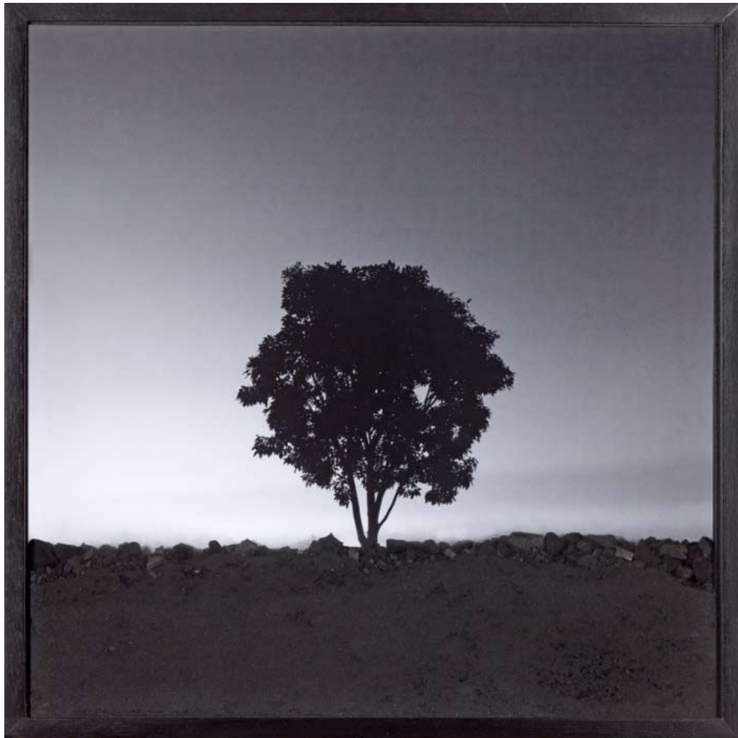
Espaço confinado #003, 2014 Impression minérale sur papier coton, charbon 45 x 45 cm Édition : 1 + 1 E.A.