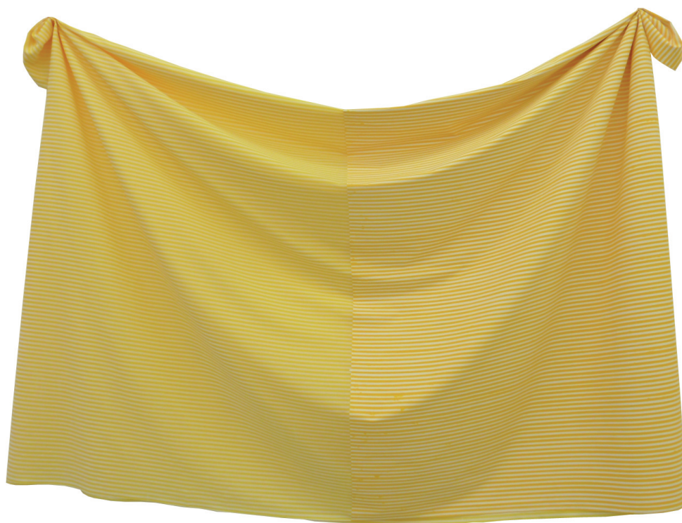
Cynthia Marcelle Untitled , 2011 acrylique sur toile industrielle 120 x 170 cm