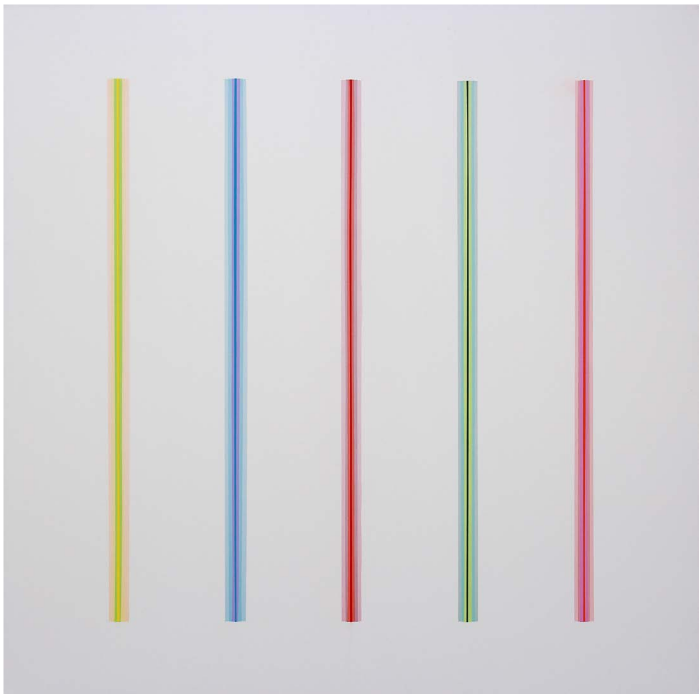
lucé , 2016 Acrylique et résine sur toile 180 x 180 cm Oeuvre unique