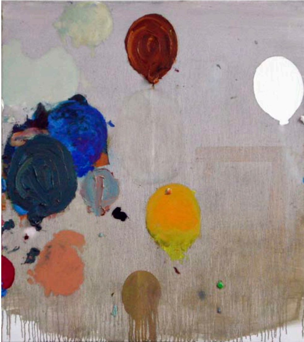
Matthias Reinmuth YoHo und ne buddel voll rum , 2009 Acrylique sur toile 105 x 90cm